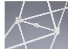
Schnell aufgebautes Spiderwall-System