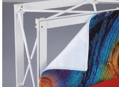
Bewährte Gummilippen Konfektion